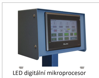
LED digitální mikroprocesor