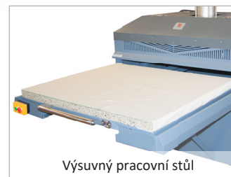
Výsuvný pracovní stůl