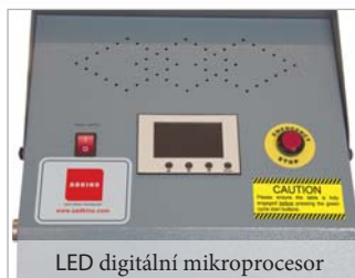
LED digitální mikroprocesor