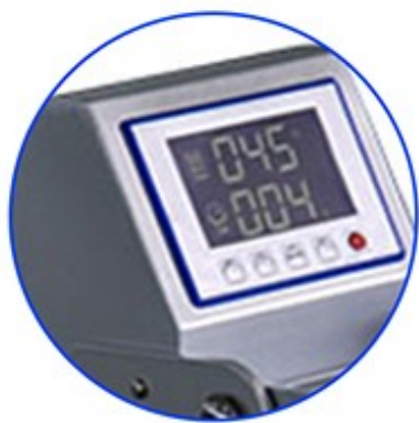
Přehledný digitální displej

Inovativní řešení plochého lisu s vertikálním otevíráním. Díky výsuvné pracovní desce se už nepopálíte. Nový mikroprocesor pro řízení teploty pracující s přesností 0,5 °C. Topná deska s tepelnou spirálou v jednom bloku. Jednoduchý systém pro výměnu pracovních desek různých velikostí.