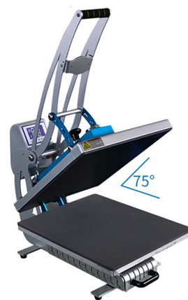
Úhel otevření 75°

Náhradní pracovní desky: 33 x 44 cm / 38 x 38 cm / 29 x 38 cm