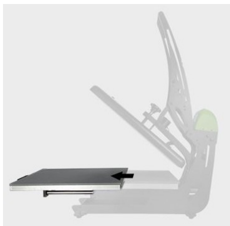
Výsuvná pracovní deska