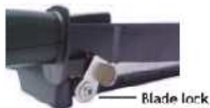
Blade lock – zámek nože