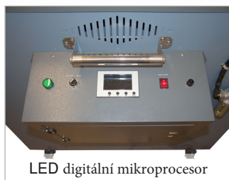
LED digitální mikroprocesor