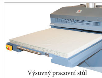
Výsuvný pracovní stůl