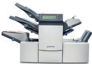
Kuvertiermaschine SI 3350